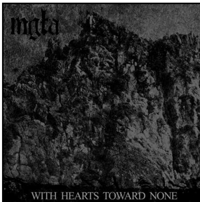
« With Hearts Toward None » (2012).

Metal в этом плане зачастую слишком близки к традиции «рок-идолов». Поэтому я решил, что в Męła этого не будет. Идея в том, что музыка сама по себе должна привлекать аудиторию. Пустой, непривлекательный, безликий имидж исполнителей идёт на пользу этой идее. Люди не отвлекаются на то, как выглядит тот или иной музыкант. То же самое относится к организации выступления, сценографии, фотосессиям — всё это настолько аскетично, насколько это возможно. Если когда-нибудь нам на ум придёт имидж, лучше подходящий нашей музыке и идеологии, мы можем использовать его. Но пока что «отрицательный» подход работает прекрасно».