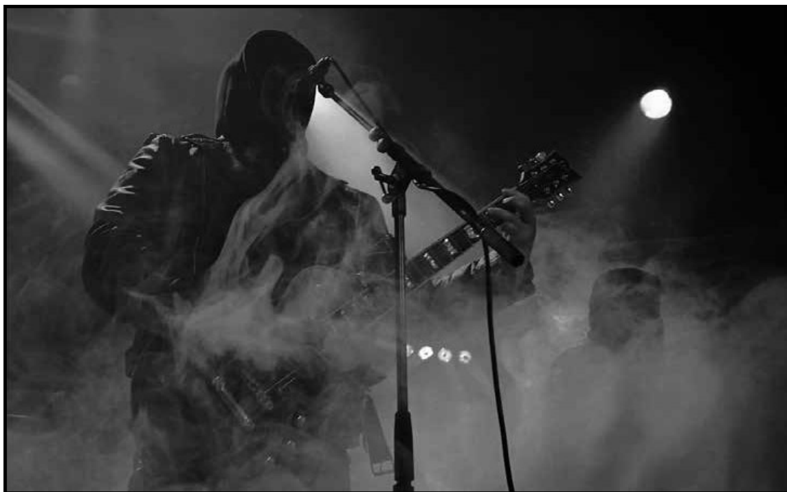
Mgła на фестивале Nidrosian Black Mass, Бельгия, год 2013-й.

«Моя роль в группе сильно изменилась, — продолжает он. — Раньше я концентрировался только на записи ударных партий, а М. выполнял остальную работу. Сегодня я помогаю ему делать практически всё, что касается Mgła. Если нужно принять какое-то важное решение, мы принимаем его сообща. И это, честно говоря, совсем не сложно. Я знаю, что у М. есть идеи, которым он будет следовать всегда, но, к счастью, большинство их я разделяю. Бывают небольшие изменения, однако мы всегда найдём компромисс, удовлетворяющий обоим».