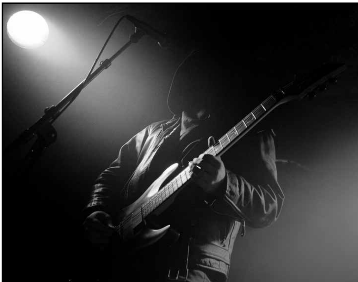
Mgła выступают в Бергене, Норвегия. Год 2013-й.

ся играть во всевозможных жанрах, но в итоге всё равно приходят к Black Metal. Нетрудно догадаться, к какому типу относимся мы».