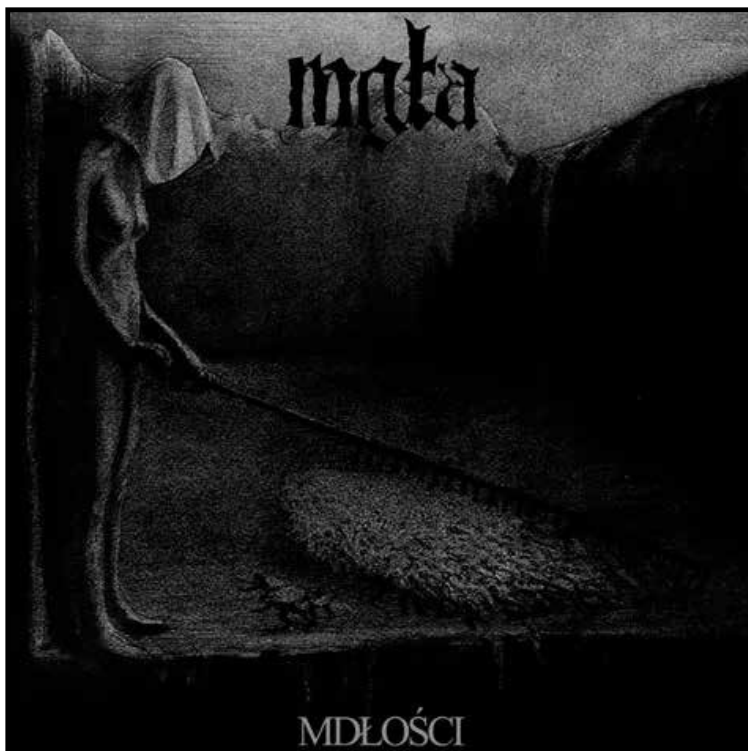
EP « Mgła » (2006).

Перед записью второго демо Necronosferatus отчалил из Kriegsmaschine, его заменил вокалист / басист Destroyer, являвшийся также участником Death Metal-акта Hate. Изменение в составе несколько не повлияло на саунд и продуктивность группы. Вскоре вышли новые демо и сплит, затем EP « A Thousand Voices » (2004), и, наконец, полноформатный альбом « Altered States Of Divinity » (2005). Последний продемонстрировал более чистое и такое же одухотворённое звучание.